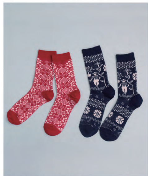
No./Color. k40155 / A Name. チロルカラーソックス 2P Size. S (22.5-24.5cm) Price. 2足組 ¥1,500 (税込 ¥1,650) Material. 綿 / ポリエステル / ポリウレタン