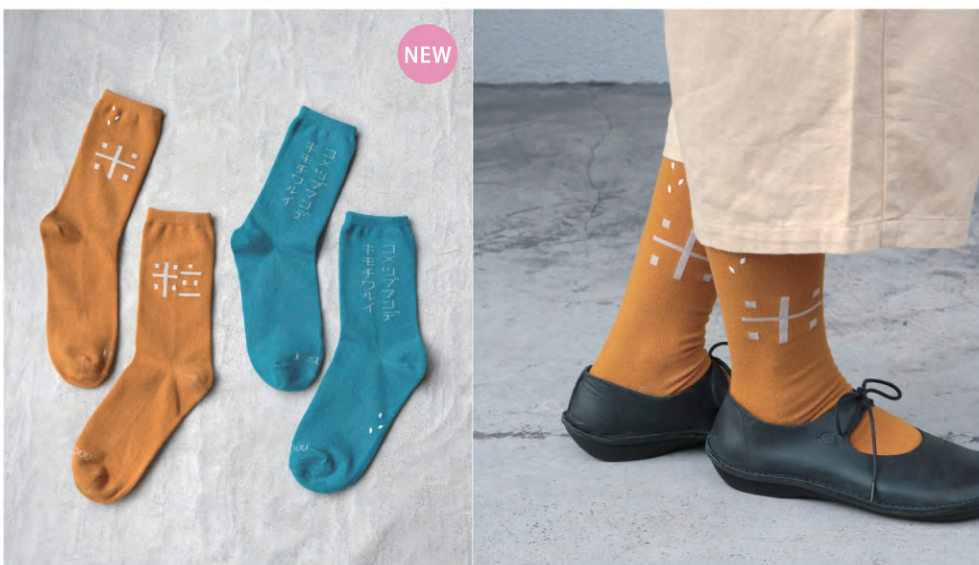
No./Color. k40412 / A Name. 米粒ついちゃったクルーソックス 2P Size. S (22.5-24.5cm) Price. 2足組 ¥1,300 (税込 ¥1,430) Material. 綿 / ポリエステル / ポリウレタン