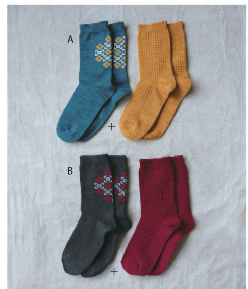
No./Color. k40161 / A , B Name. クレスト&ワッフルクルーソックス 2P Size. S (22.5-24.5cm) Price. 2足組 ¥1,200 (税込 ¥1,320) Material. 綿 / ポリエステル / ポリウレタン