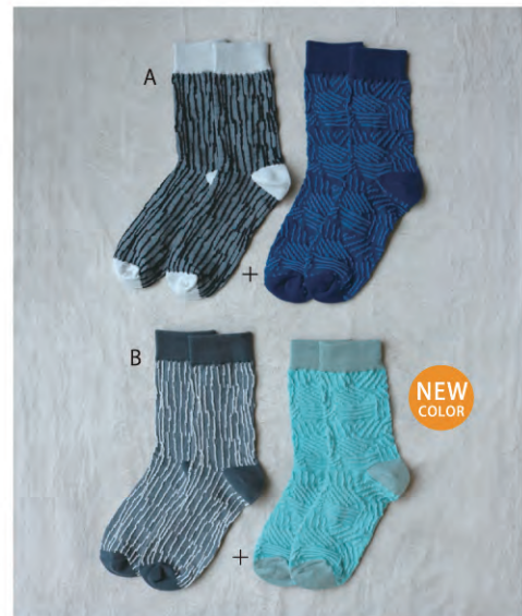
No./Color. k40375 / A, B Name. デッサンパターンクルーソックス 2P Size. S (22.5-24.5cm) Price. 2足組 ¥1,500 (税込 ¥1,650) Material. 綿 / ポリエステル / ポリウレタン