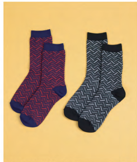
No./Color. k40156 / A Name. ヘリンボンジャガードクルーソックス 2P Size. S (22.5-24.5cm) M (25-27cm) Price. 2足組 ¥1,500 (税込 ¥1,650) Material. 綿 / ポリエステル / ポリウレタン