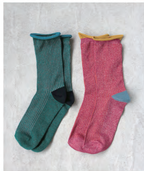
No./Color. k40373 / A Name. ウエイピング ラメカラーソックス 2P Size. S (22.5-24.5cm) Price. 2足組 ¥1,500 (税込 ¥1,650) Material. 綿 / ポリエステル / ポリウレタン