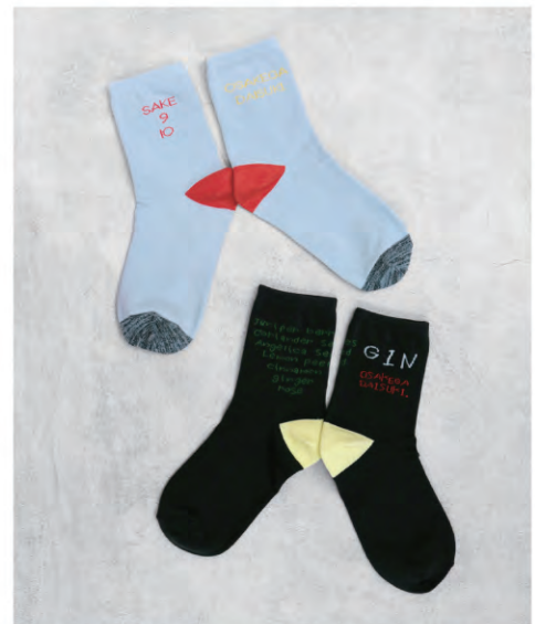
No./Color. k30352 / A Name. OSAKEGA DAISUKI ショートソックス 2P Size. S (22.5-24.5cm) Price. 2足組 ¥1,200 (税込 ¥1,320) Material. 綿 / ポリエステル / ポリウレタン