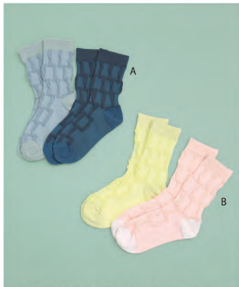
No./Color. k40388 / A, B Name. マカロニクルーソックス 2P Size. S (22.5-24.5cm) Price. 2足組 ¥1,300 (税込 ¥1,430) Material. 綿 / ポリエステル / ポリウレタン