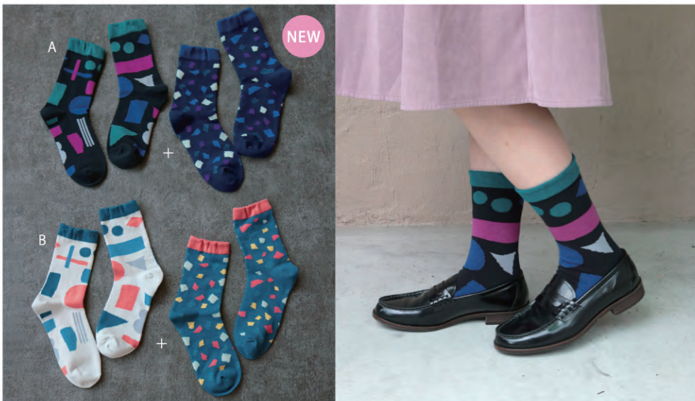
No./Color. k40407 / A , B Name. カケラクルーソックス 2P Size. S (22.5-24.5cm) Price. 2足組 ¥1,500 (税込 ¥1,650) Material. 綿 / ポリエステル / ポリウレタン