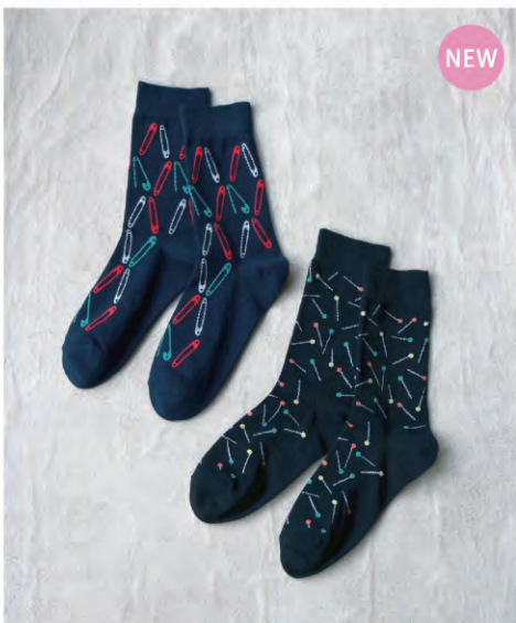
No./Color. k40405 / A Name. ピンクルーソックス 2P Size. S (22.5-24.5cm) Price. 2足組 ¥1,500 (税込 ¥1,650) Material. 綿 / ポリエステル / ポリウレタン