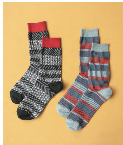
No./Color. k40148 / A Name. ジグザグ&イチマツクルーソックス 2P Size. S (22.5-24.5cm) M (25-27cm) Price. 2足組 ¥1,500 (税込 ¥1,650) Material. 綿 / ポリエステル / ポリウレタン