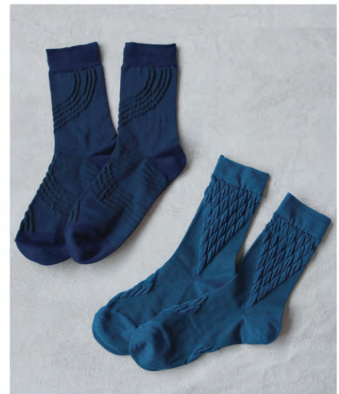
No./Color. k40264 / A Name. フローイングフロントクルーソックス 2P Size. S (22.5-24.5cm) Price. 2足組 ¥1,500 (税込 ¥1,650) Material. 綿 / ポリエステル / ポリウレタン