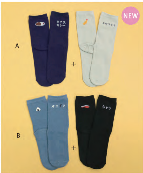
No./Color. k40387 / A, B Name. 和食&洋食クルーソックス 2P Size. S (22.5-24.5cm) Price. 2足組 ¥1,200 (税込 ¥1,320) Material. 綿 / ポリエステル / その他