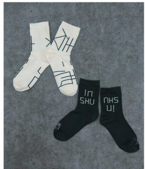
No./Color. k30235 / A Name. BEER ショートソックス 2P Size. S (22.5-24.5cm) Price. 2足組 ¥1,000 (税込 ¥1,100) Material. 綿 / ポリエステル / ポリウレタン