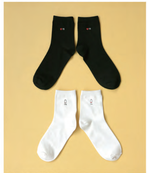
No./Color. k30346 / A Name. LOVE & CHARGE クールソックス 2P Size. S (22.5-24.5cm) Price. 2足組 ¥1,000 (税込 ¥1,100) Material. 綿 / ポリエステル / ポリウレタン