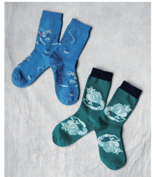
No./Color. k40385 / A Name. タイガー&ドラゴンクルーソックス 2P Size. S (22.5-24.5cm) Price. 2足組 ¥1,300 (税込 ¥1,430) Material. 綿 / ポリエステル / ポリウレタン