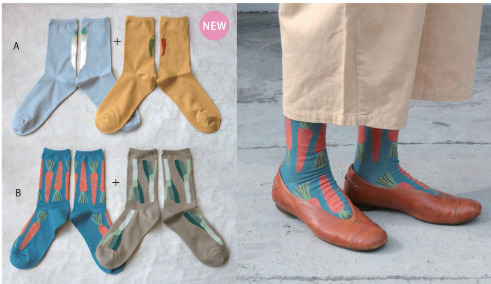
No./Color. k40418 / A , B Name. ベジタブルクルーソックス 2P Size. S (22.5-24.5cm) Price. 2足組 ¥1,500 (税込 ¥1,650) Material. 綿 / ポリエステル / ポリウレタン