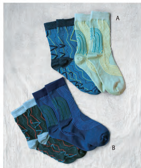
No./Color. k40384 / A, B Name. ウォーターフロア カラーソックス 2P Size. S (22.5-24.5cm) Price. 2足組 ¥1,500 (税込 ¥1,650) Material. 綿 / ポリエステル / その他