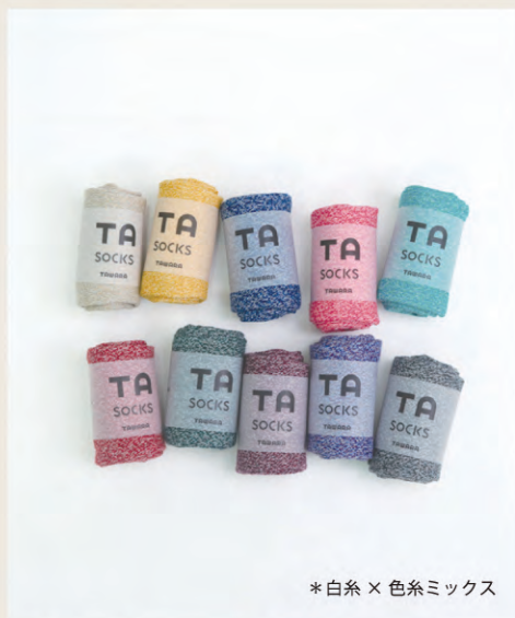
*白糸 × 色糸ミックス

思わず手に取りたくなるコロんとした たわら型フォルム がかわいい “くるくるした靴下と雑貨”のブランドです。 シンプルなデザインで、ちょっとしたプレゼントにもオススメです。