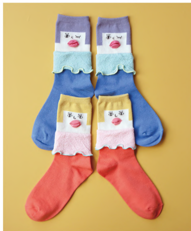
No./Color. k40913 / A Name. マチルダとイザベラクルーソックス 2P Size. S (22.5-24.5cm) Price. 2足組 ¥1,700 (税込 ¥1,870) Material. 綿 / ポリエステル / その他