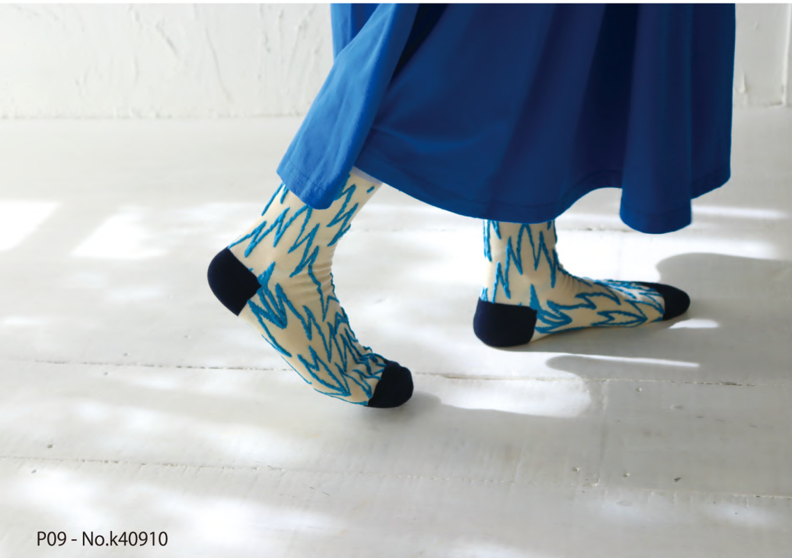
P09 - No.k40910