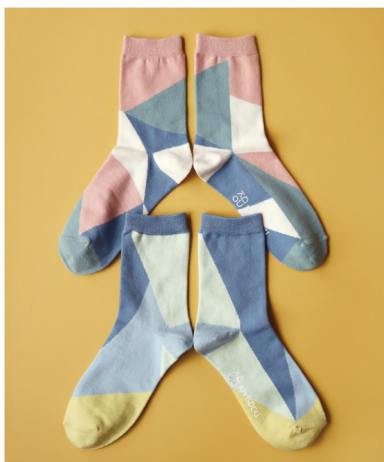
No./Color. k30910 / A Name. ライティングカラー ショートソックス 2P Size. S (22.5-24.5cm) Price. 2足組 ¥1,400 (税込 ¥1,540) Material. 綿 / ポリエステル / その他