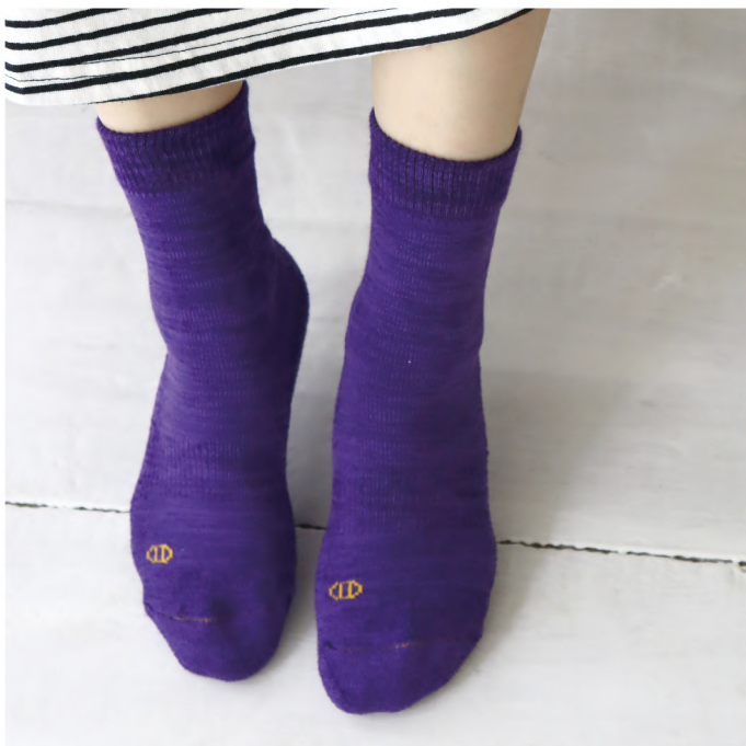
No. t40802 Name. コットンパイル クルーソックス Size. S (22.5-24.5cm) Price. ¥800 (税込¥880) Material. 綿 / ポリエステル / ポリウレタン