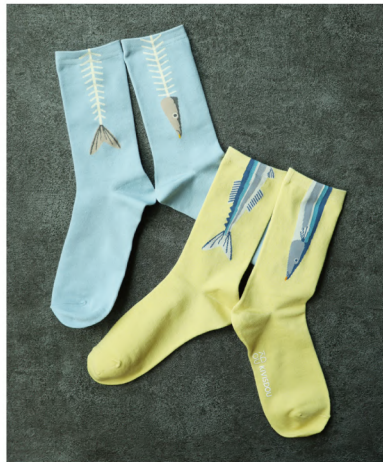
No./Color. k40918 / A Name. さんま1匹ハイゲージクルーソックス 2P Size. S (22.5-24.5cm) Price. 2足組 ¥1,500 (税込 ¥1,650) Material. 綿 / ポリエステル / その他