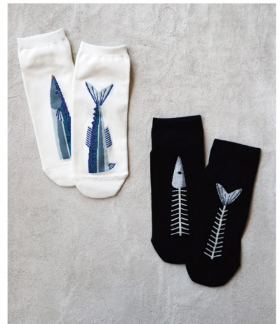
No./Color. k20904 / A Name. さんま アンクルソックス 2P Size. S (22.5-24.5cm) Price. 2足組 ¥1,400 (税込 ¥1,540) Material. 綿 / ポリエステル / その他