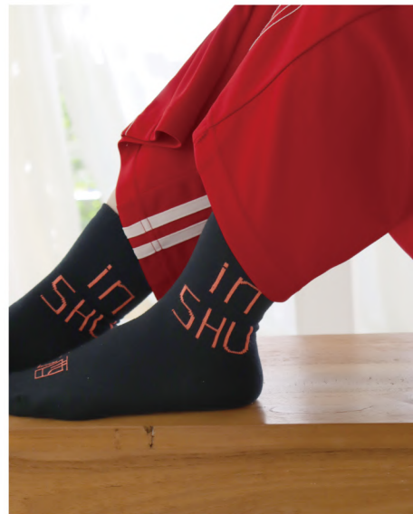
P09 - No.k30903