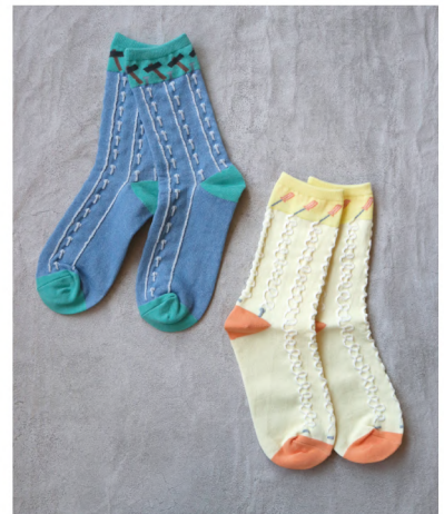
No./Color. k40914 / A Name. ドライバー&トンカチクルーソックス 2P Size. S (22.5-24.5cm) Price. 2足組 ¥1,700 (税込 ¥1,870) Material. 綿 / ポリエステル / その他