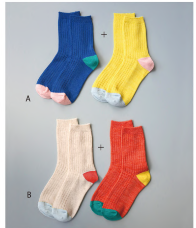
No./Color. k30912 / A, B Name. リネンバレットショートソックス 2P Size. S (22.5-24.5cm) Price. 2足組 ¥1,800 (税込 ¥1,980) Material. アクリル / テンセル / ポリエステル / リネン / ポリウレタン