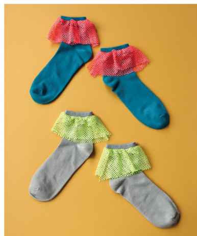
No./Color. k30914 / A Name. ネオンレース ショートソックス 2P Size. S (22.5-24.5cm) Price. 2足組 ¥1,800 (税込 ¥1,980) Material. 綿 / ポリエステル / その他