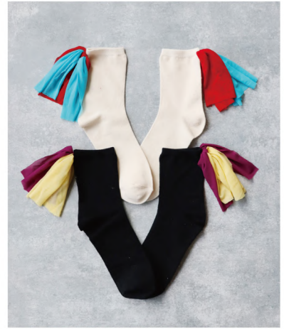
No./Color. k30998 / A Name. チュールリボンショートソックス 2P Size. S (22.5-24.5cm) Price. 2足組 ¥1,800 (税込 ¥1,980) Material. 綿 / ポリエステル / その他