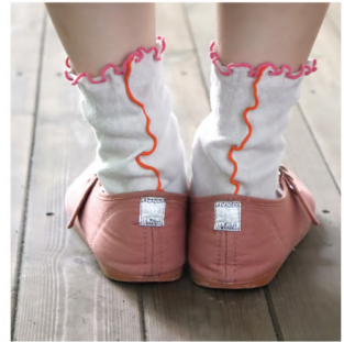
P10 - No.k30916