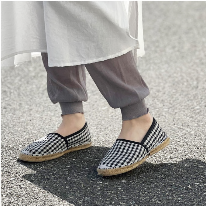
No. t60563 Name. ゆるっとガーゼ編みコットンレギンス Size. F (ヒップ: 85 - 95 c m) Price. ¥2,300 (税込¥2,530) Material. 綿 / ポリエチレン