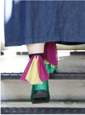
P10 - No.k30998