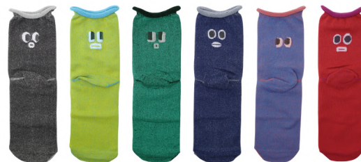
13 ブラック 36 イエロー 45 グリーン 50 ネイビー 58 ライトブルー 651 レッド

No. t30892 Name. KAO ショートソックス Size. S (22.5-24.5cm) Price. ¥600 (税込¥660) Material. 綿 / ポリエステル / ポリウレタン