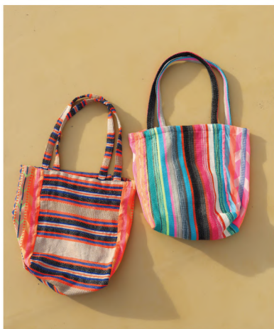
No./Color. k80953 Name. インディアジャガード トートバッグ Size. F (W26×D15×H34 持ち手 L67cm) Price. ¥3,200 (税込 ¥3,520) Material. 綿