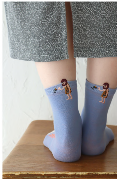
P09 - No.k30902