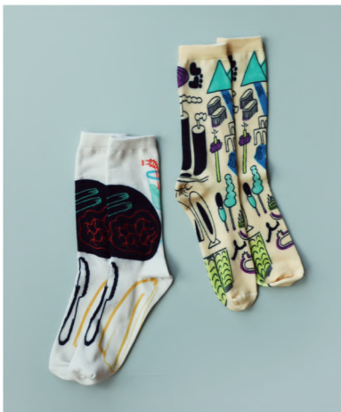
No./Color. k40911 / A Name. ※it's all fiction. プリントクルーソックス 2P Size. S (22.5-24.5cm) Price. 2足組 ¥1,600 (税込 ¥1,760) Material. ポリエステル / ポリウレタン / その他