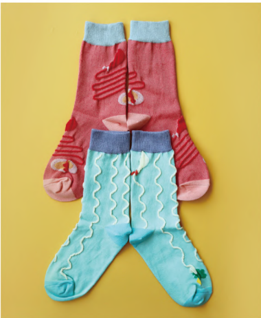
No./Color. k40915 / A Name. マヨネーズ&ケチャップクルーソックス 2P Size. S (22.5-24.5cm) Price. 2足組 ¥1,700 (税込 ¥1,870) Material. 綿 / ポリエステル / その他