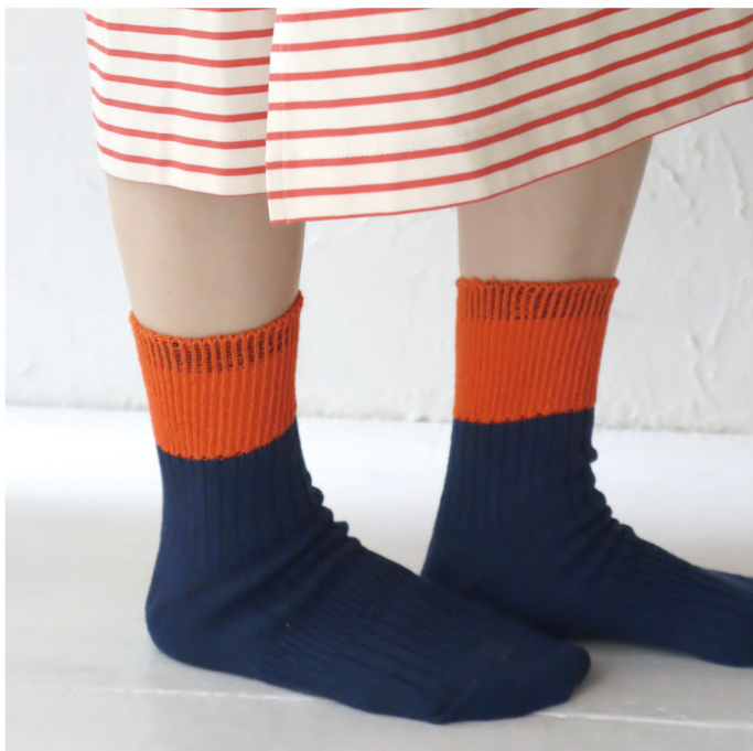
No. t30915 Name. リネン×コットン バイカラー リブショートソックス Size. S (22.5-24.5cm) Price. ¥1,200 (税込 ¥1,320) Material. リネン / 綿 / ポリエステル / ポリウレタン