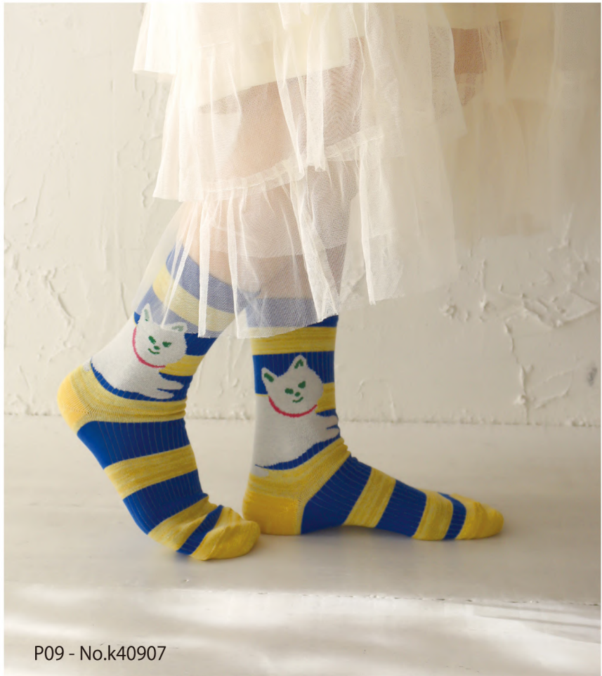
P09 - No.k40907