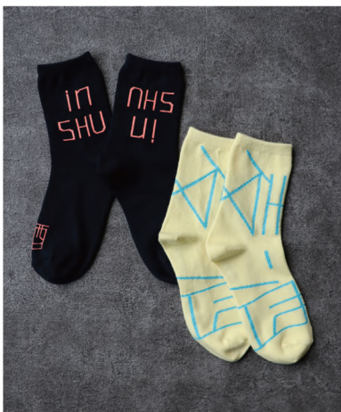
No./Color. k30903 / A Name. BEER ショートソックス 2P Size. S (22.5-24.5cm) Price. 2足組 ¥1,500 (税込 ¥1,650) Material. 綿 / ポリエステル / その他