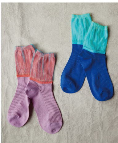
No./Color. k30913 / A Name. シアーバルーン ショートソックス 2P Size. S (22.5-24.5cm) Price. 2足組 ¥1,600 (税込 ¥1,760) Material. 綿 / ナイロン / その他