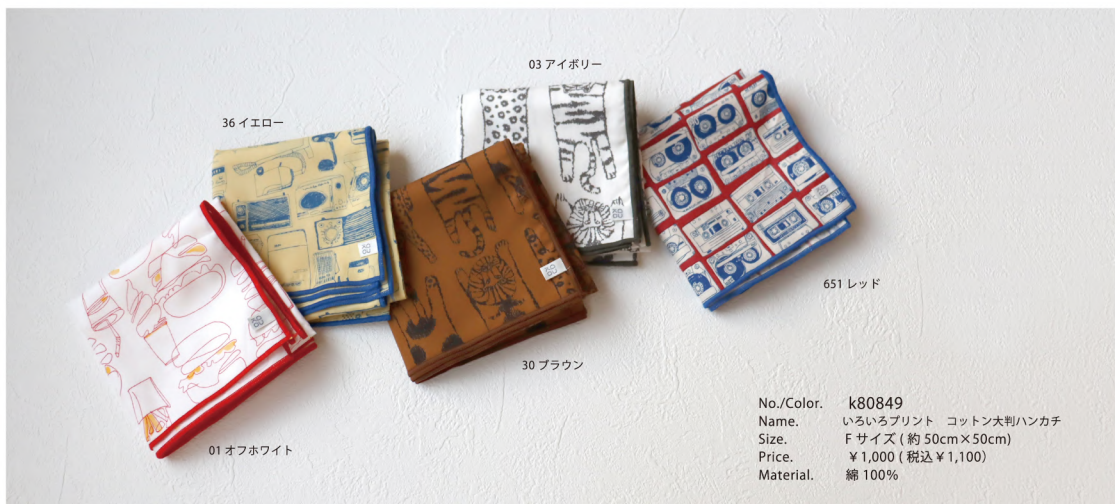
No./Color. k80849 Name. いろいろプリント コットン判ハンカチ Size. Fサイズ (約50cm×50cm) Price. ¥1,000 (税込 ¥1,100) Material. 綿 100%