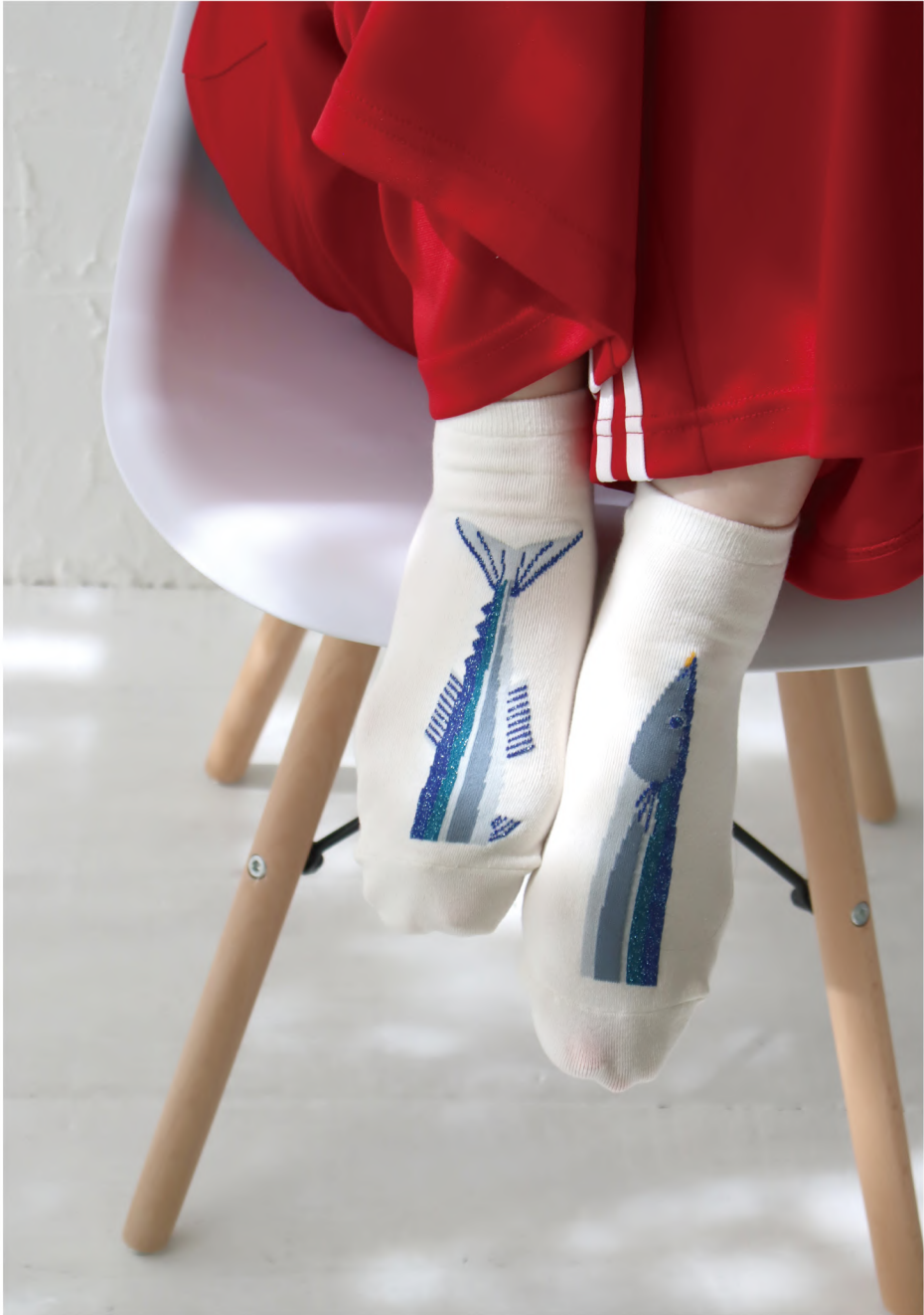
P10 - No.k20904