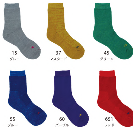
15 グレー 37 マスタード 45 グリーン 55 ブルー 60 パープル 651 レッド