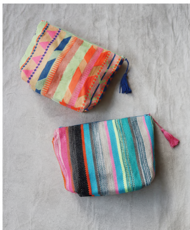
No./Color. k80954 Name. インディアジャガード ビッグポーチ Size. F (W26×D7×H19cm) Price. ¥2,200 (税込 ¥2,420) Material. 綿