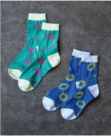
No./Color. k30999 / A Name. 縋り物 シアーショートソックス 2P Size. S (22.5-24.5cm) Price. 2足組 ¥1,600 (税込 ¥1,760) Material. 綿 / ナイロン / その他