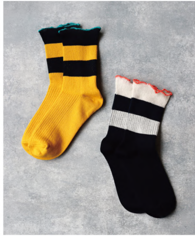
No./Color. k30990 / A Name. フラッターリップショートソックス 2P Size. S (22.5-24.5cm) Price. 2足組 ¥1,700 (税込 ¥1,870) Material. 綿 / ポリエステル / その他