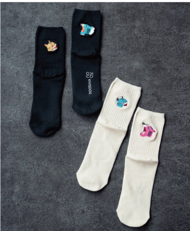
No./Color. k30891 / A Name. 鳴きマネ 刺繍ショートソックス 2P Size. S (22.5-24.5cm) Price. 2足組 ¥1,500 (税込 ¥1,650) Material. 綿 / ポリエステル / その他