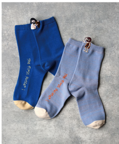
No./Color. k30902 / A Name. ご先祖様はアーティスト ショートソックス 2P Size. S (22.5-24.5cm) Price. 2足組 ¥1,600 (税込 ¥1,760) Material. 綿 / ポリエステル / その他