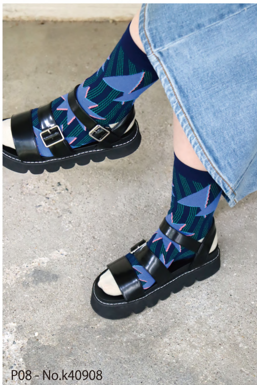
P08 - No.k40908