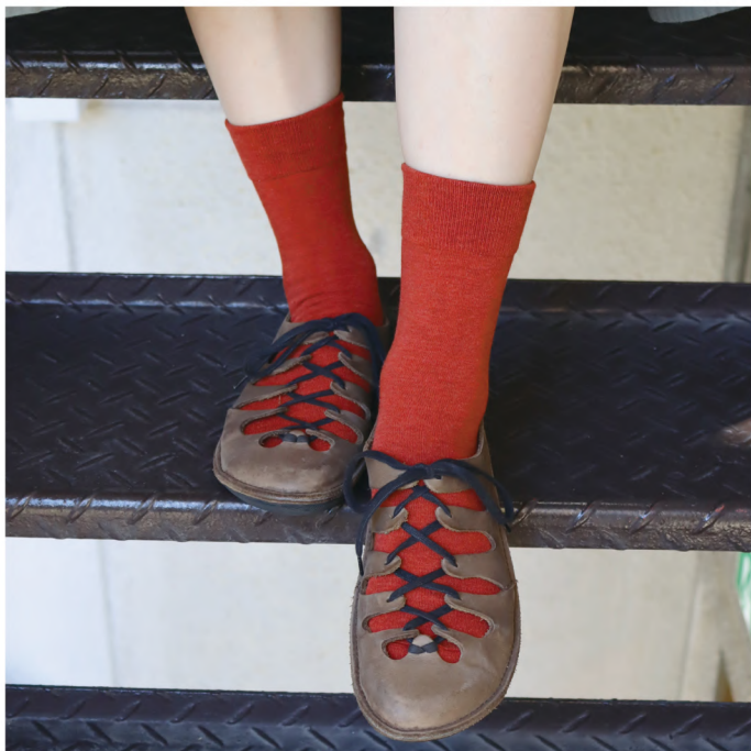
No. t30908 Name. メランツ ハイゲージ ショートソックス Size. S (22.5-24.5cm) Price. ¥600 (税込 ¥660) Material. ポリエステル / 綿 / その他