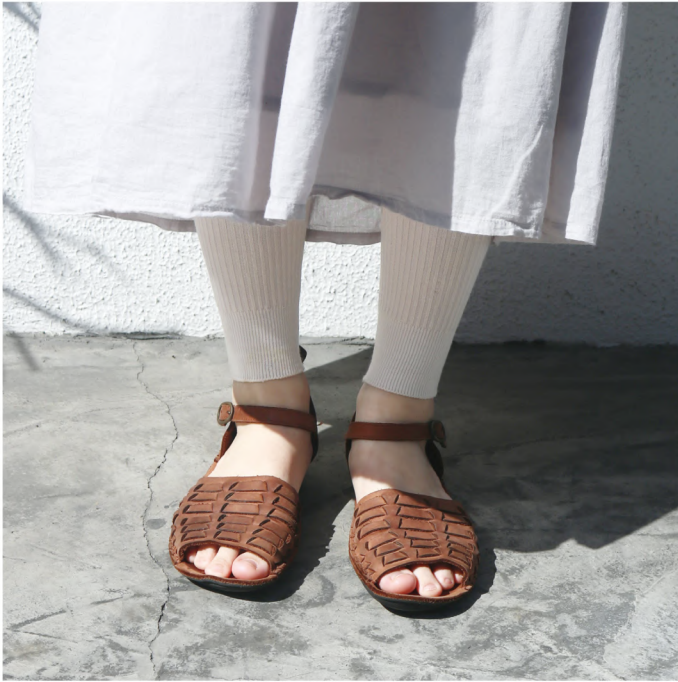
No. t60564 Name. やわらかコットンリブレギンス Size. F (ヒップ: 85 - 95 c m) Price. ¥2,300 (税込¥2,530) Material. 綿 / ポリエステル / ポリウレタン