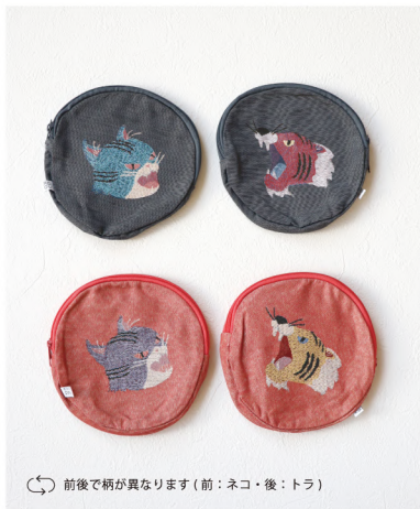
前後で柄が異なります(前:ネコ・後:トラ)

No./Color. k80845 Name. 鳴きマネ ゴブラン織リ丸ポーチ Size. Fサイズ Price. ¥1,800 (税込¥1,980) Material. ポリエステル/綿/レーヨン/ナイロン