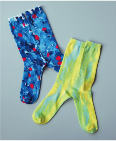
No./Color. k40917 / A Name. カナリアの水浴びプリントクルーソックス 2P Size. S (22.5-24.5cm) Price. 2足組 ¥1,600 (税込 ¥1,760) Material. ポリエステル / ポリウレタン / その他