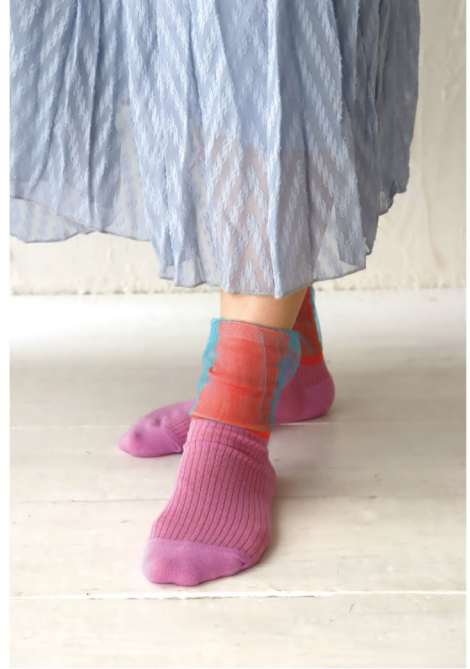
P09 - No.k30913