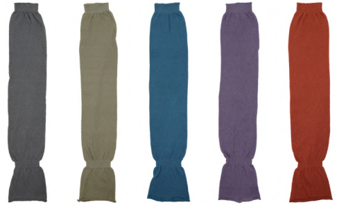
08 チャコール 23 グレーベージュ 49 ブルーグリーン 60 パープル 66 レンガ

No. t60983 Name. コットン/リネン ゆるアームウォーマー Size. F (長さ: 約 60 c m) Price. ¥ 1,300 (税込 ¥ 1,430) Material. 綿 / リネン / その他