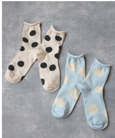
No./Color. k30911 / A Name. リネドットショートソックス 2P Size. S (22.5-24.5cm) Price. 2足組 ¥1,800 (税込 ¥1,980) Material. アクリル / テンセル / ポリエステル / リネン / ポリウレタン