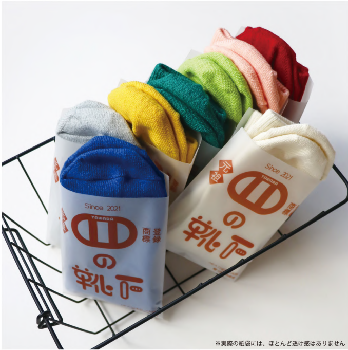
※実際の紙袋には、ほとんど透け感はありません

No. t30917 Name. コットンコロケソックス Size. S (22.5-24.5cm) Price. ¥700 (税込¥770) Material. 綿 / ポリエステル / その他