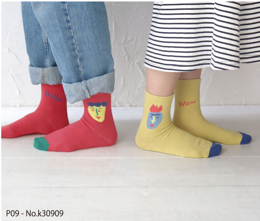
P09 - No.k30909