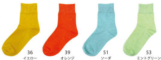
36 イエロー 39 オレンジ 51 ソーダ 53 ミントグリーン 54 ディープブルー 60 パープル 126 ネオンピンク 651 レッド

No. t30360 Name. チラミセ ハイゲージ ショートソックス Size. F (23-26cm) Price. ¥600 (税込¥660) Material. ポリエステル / レーヨン / その他