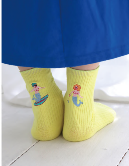
P10 - No.k30901