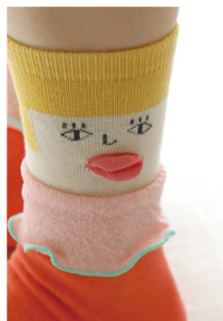
P08 - No.k40913