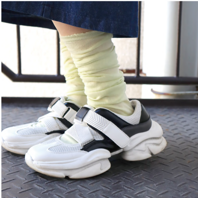
No. t50911 Name. くしゅのび エアーハイソックス Size. S (22.5-24.5cm) Price. ¥800 (税込¥880) Material. 綿 / ナイロン / その他