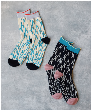
No./Color. k40910 / A Name. BUMPY クルーソックス 2P Size. S (22.5-24.5cm) Price. 2足組 ¥1,700 (税込 ¥1,870) Material. 綿 / ポリエステル / その他