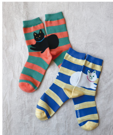
No./Color. k40907 / A Name. おずわりキャット クルーソックス 2P Size. S (22.5-24.5cm) Price. 2足組 ¥1,600 (税込 ¥1,760) Material. 綿 / ポリエステル / その他