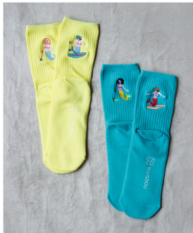
No./Color. k30901 / A Name. むっちりマーメイド 刺繍ショートソックス 2P Size. S (22.5-24.5cm) Price. 2足組 ¥1,600 (税込 ¥1,760) Material. 綿 / ポリエステル / その他