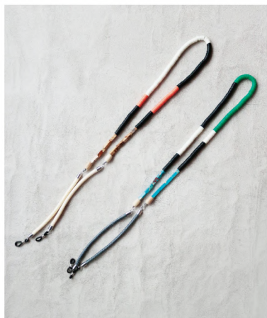
No./Color. k80739 / 39 オレンジ, 45 グリーン Name. カラービーズ グラスコード Size. F (L80cm) Price. ¥2,000 (税込 ¥2,200)