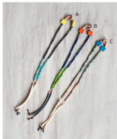
No./Color. k80740 / A, B, C Name. ストーンビーズ グラスコード Size. F (L76cm) Price. ¥2,600 (税込 ¥2,860)