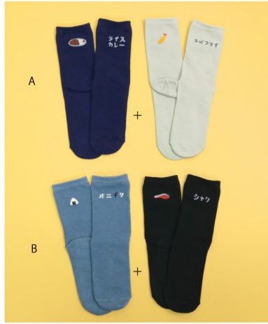
No./Color. k40387 / A, B Name. 和食&洋食クルーソックス 2P Size. S (22.5-24.5cm) Price. 2足組 ¥1,500 (税込 ¥1,650) Material. 綿 / ポリエステル / その他