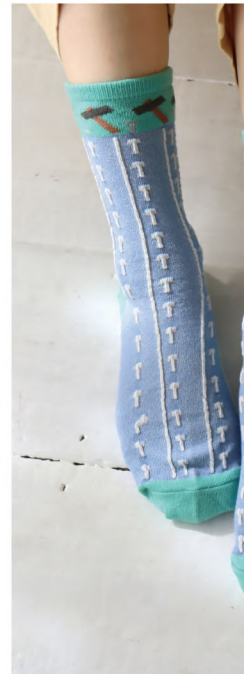
P08 - No.k40914