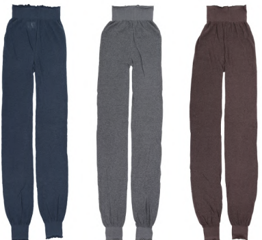
08 チャコール 17 ダークグレー 302 モカ

No. t60988 Name. ゆるっとガーゼ編みコットン レギンス Size. F (ヒップ: 85 - 95 c m) Price. ¥ 2,300 (税込 ¥ 2,530) Material. 綿 / ポリエチレン