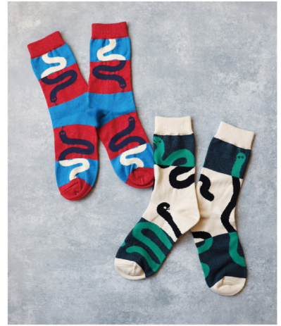
No./Color. k40906 / A Name. へびへびクルーソックス 2P Size. S (22.5-24.5cm) Price. 2足組 ¥1,700 (税込 ¥1,870) Material. 綿 / ポリエステル / その他