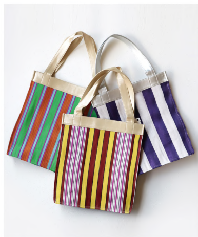
No./Color. k80955 Name. インディアメッシュ トートバッグ Size. F (W34×D14×H38 持ち手 L55cm) Price. ¥2,700 (税込 ¥2,970) Material. メッシュ地: ポリエステル 持ち手: ポリウレタン