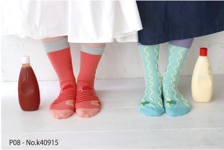
P08 - No.k40915