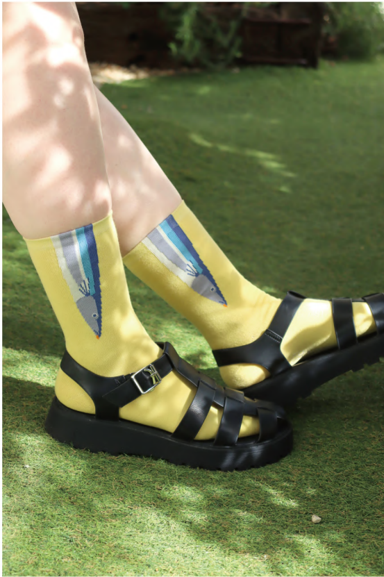
P08 - No.k40918