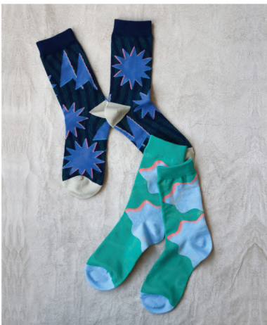
No./Color. k40908 / A Name. メディテーションクルーソックス 2P Size. S (22.5-24.5cm) Price. 2足組 ¥1,500 (税込 ¥1,650) Material. 綿 / ポリエステル / その他