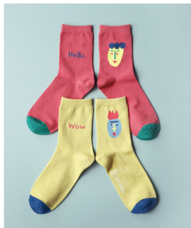
No./Color. k30909 / A Name. Hello & Wow ショートソックス 2P Size. S (22.5-24.5cm) Price. 2足組 ¥1,400 (税込 ¥1,540) Material. 綿 / ポリエステル / その他