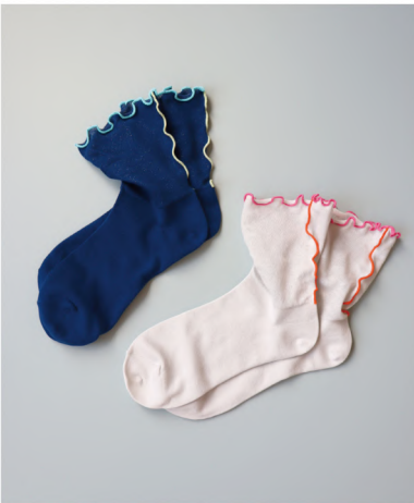
No./Color. k30916 / A Name. メロウラインショートソックス 2P Size. S (22.5-24.5cm) Price. 2足組 ¥1,600 (税込 ¥1,760) Material. 綿 / ナイロン / その他