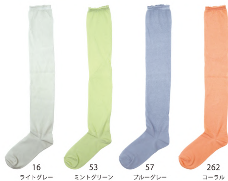
16 ライトグレー 53 ミントグリーン 57 ブルーグレー 262 コーラル