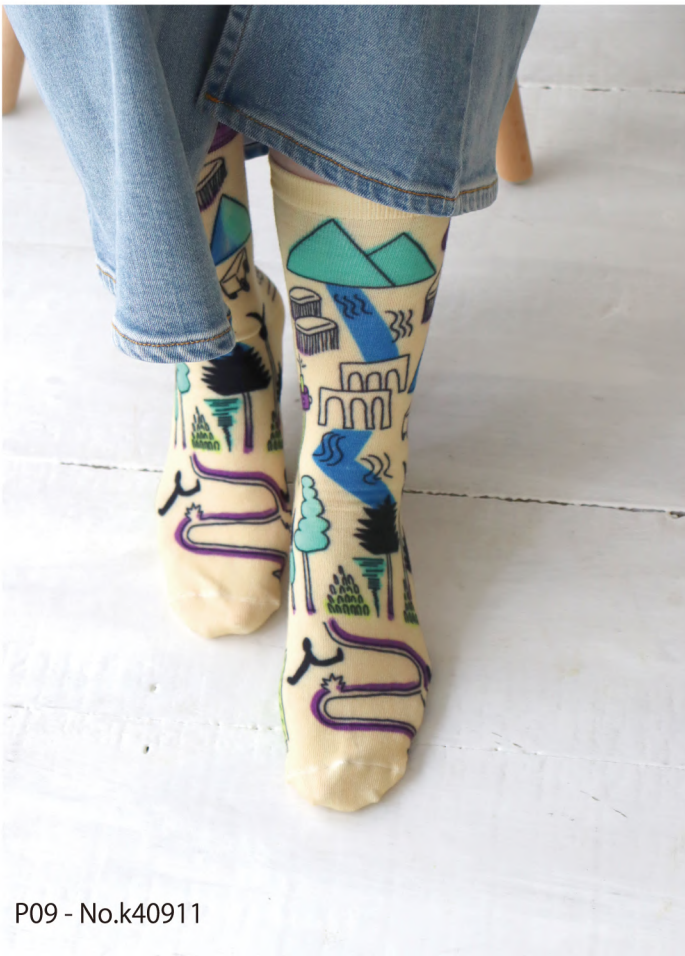
P09 - No.k40911