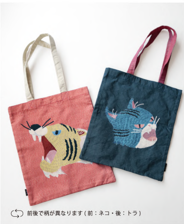
前後で柄が異なります(前:ネコ・後:トラ)

No./Color. k80844 Name. 鳴きマネ ゴブラン織リトートバッグ Size. Fサイズ Price. ¥3,600 (税込¥3,960) Material. ポリエステル/綿/レーヨン/ナイロン