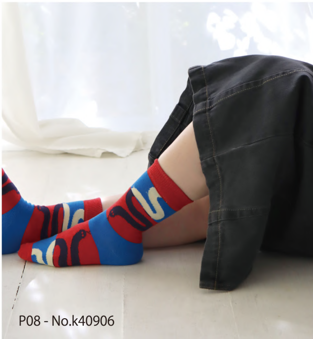
P08 - No.k40906