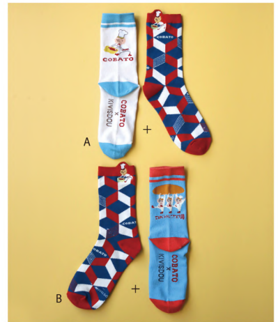
No./Color. k40919 / A, B Name. COBATO×KIVISDOUクルーソックス 2P Size. S (22.5-24.5cm) Price. 2足組 ¥1,800 (税込 ¥1,980) Material. 綿 / ポリエステル / その他